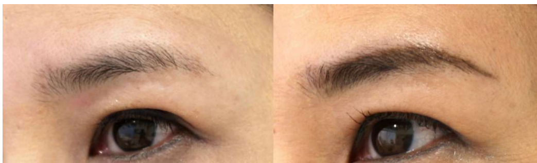
左 施術前。右 施術2か月後、自然な仕上がりです。デザインと使用する国産の安全な色素の賜物です。